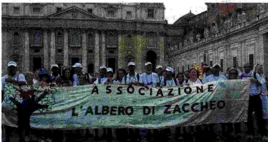
Via Francigena - Immagini dal pellegrinaggio verso Saint-Maurice d' Agaune