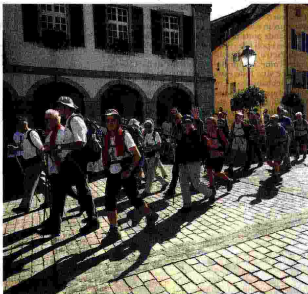
■ Dal 20 al 30 Agosto un gruppo di pellegrini ha percorso la via Francigena da Ivrea fino all'Abbazia di Saint-Maurice d' Agaune, in Vallese, in occasione del 1500 anni della sua fondazione. Nelle foto vediamo alcuni dei momenti del pellegrinaggio.